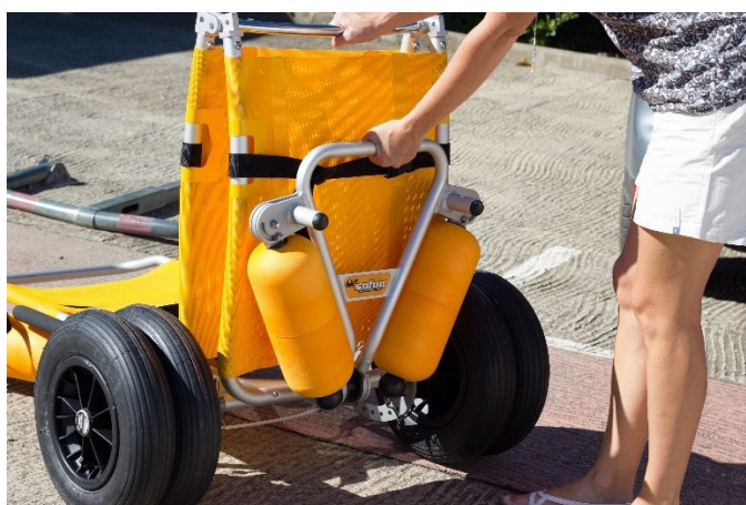
6. Sitzfläche ausklappen