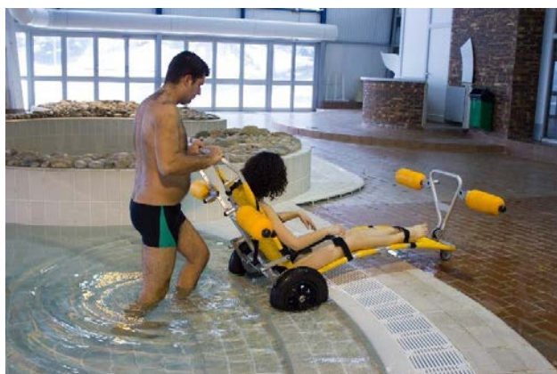
Die Treppe hinuntergehen