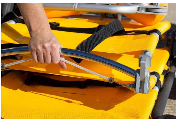
5. Rückenlehne aufklappen