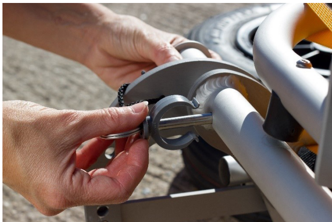
1. Entfernen Sie die Sicherungsstifte an den Radachsen.