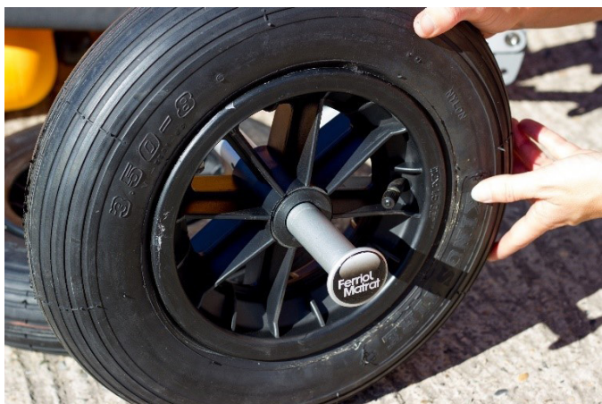
3. Schieben Sie die Räder mit dem Ventil nach außen auf ihre Achsen und setzen Sie die Achsen wieder in die ihren Sitz.