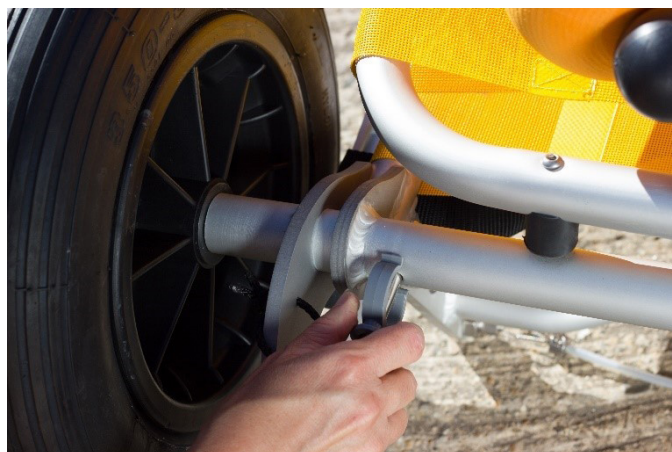
4. Setzen Sie die Sicherungsstifte wieder ein.