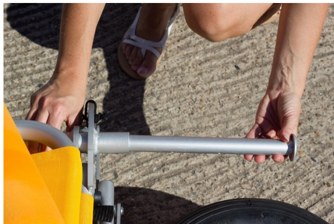
2. Entfernen Sie die Radachsen.