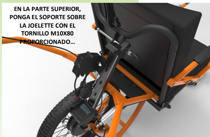
EN LA PARTE SUPERIOR, PONGA EL SOPORTE SOBRE LA JOLETTE CON EL TORNILLO M10X80 PROPORCIONADO...