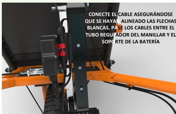
CONECTE EL CABLE ASEGURÁNDOSE QUE SE HAYAN ALINEADO LAS FLECHAS BLANCAS. PASE LOS CABLES ENTRE EL TUBO REGULADOR DEL MANILLAR Y EL SOPORTE DE LA BATERÍA