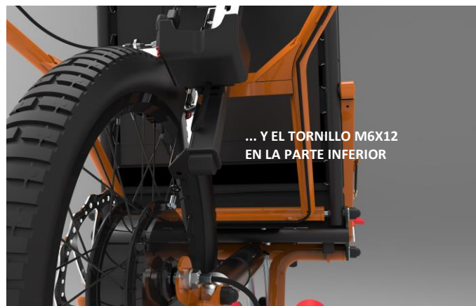
... Y EL TORNILLO M6X12 EN LA PARTE INFERIOR