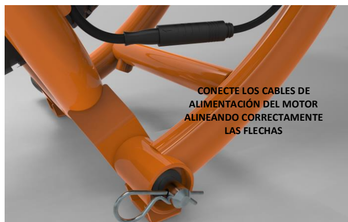
CONECTE LOS CABLES DE ALIMENTACIÓN DEL MOTOR ALINEANDO CORRECTAMENTE LAS FLECHAS