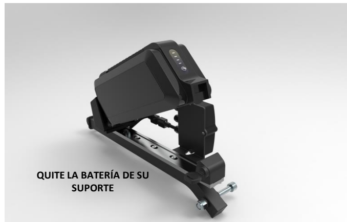
QUITE LA BATERÍA DE SU SUPORTE