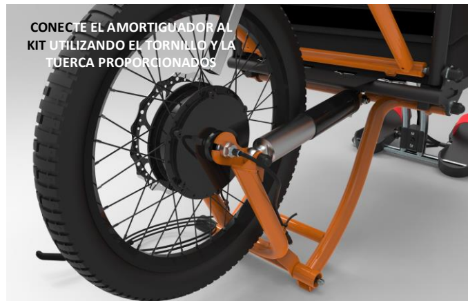
CONECTE EL AMORTIGUADOR AL KIT UTILIZANDO EL TORNILLO Y LA TUERCA PROPORCIONADOS