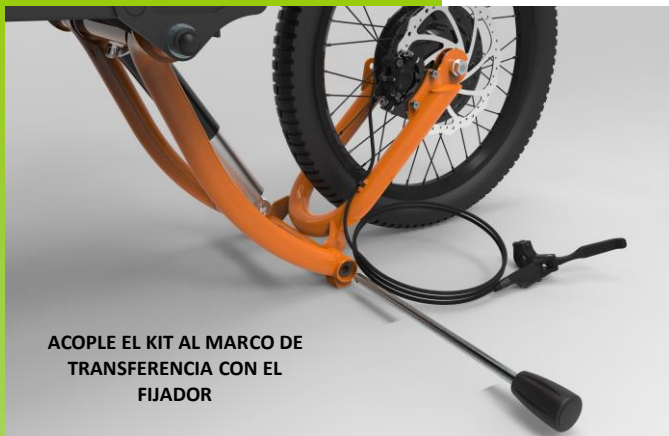
ACOPLE EL KIT AL MARCO DE TRANSFERENCIA CON EL FIJADOR