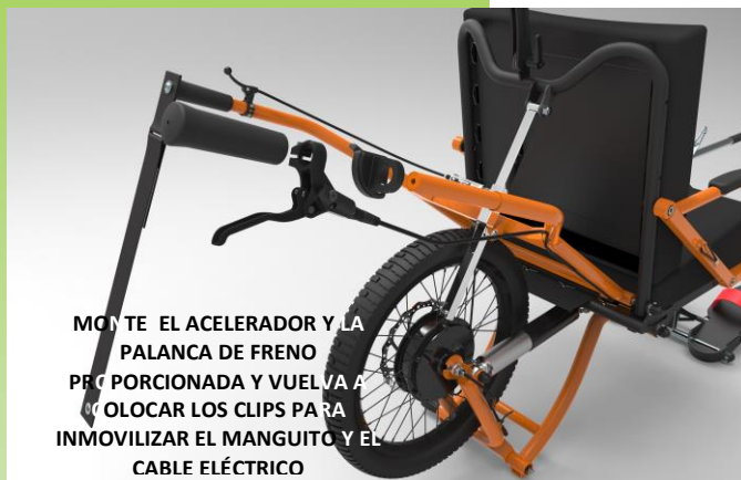
MONTE EL ACELERADOR Y LA PALANCA DE FRENO PROPORCIONADA Y VUELVA A PEGAR LOS CLIPS PARA INMOVILIZAR EL MANGUITO Y EL CABLE ELÉCTRICO